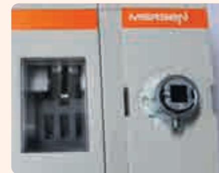
Безопасность: Прозрачное окно позволяет видеть положение рубильника